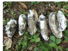
作業後待つこと20分