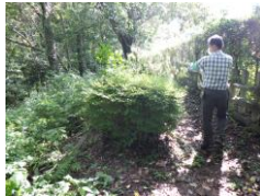
まずは枝で叩いて蜂の巣がないかチェック 剪定開始

物置に異常がないかチェックして、使用した刃物の手入れ、爽やかな汗をかいて解散となった。