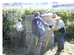
使用した万能袋を収納