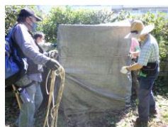
月一回の確認が大切