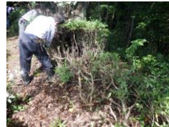
いつもながらザックリ伐る