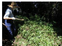
来年春にはまた花が期待できる