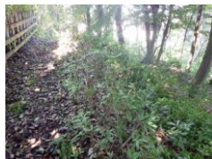
夏の暑さと雨で延期になっていた ようやく剪定ができた