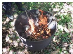
雨上がりで火付きが悪い