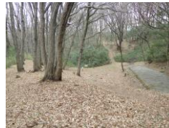
コンサート広場が間伐されて綺麗に