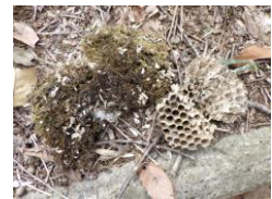
巣材と蜂の巣が出てきた