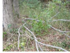
落ちてきた枝に直撃された巣箱は粉々になっていた