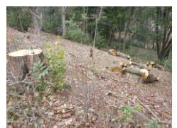
テニスコートに面した大木

連絡事項 ・怪我、ヒヤリハットなし。 ・ボランティア袋小1個を指定の場所に置く。