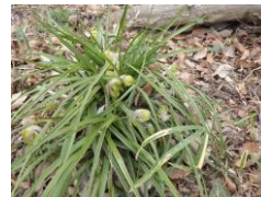
多様な植物が目立ってきた