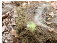
黄色はテニスボールのフェルト