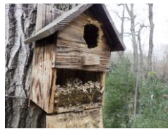
昨年に比べて今年は巣材が入っている巣箱が多かった