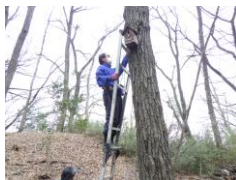
高所作業は注意深く