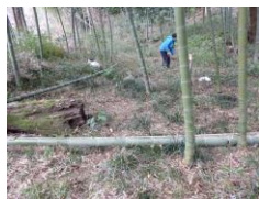
竹林は強風で5本ほどが倒れていたもので片づける