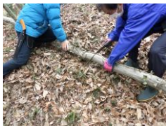
歩道を塞ぐ倒木を片づける