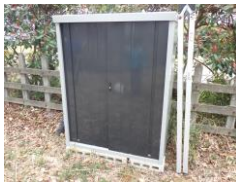
久々に倉庫をチェック

カタクリの群生を見ながら竹林へ移動、強風で数本が倒れており撤去した。筍は全く出ておらず、昨年よりも遅い印象がある。次回4月28日は駆除するにはちょうどよい時期となりそうだ。